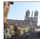
Piazza di Spagna