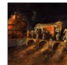
Scuola di via Cavour