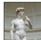
Accademia di belle arti d