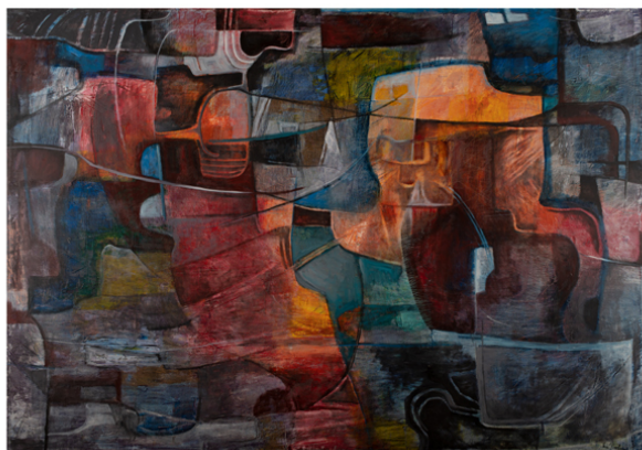
Eva Fischer - Sfinge (Sphynx) - Olio su tela del 1991 - cm. 140x200