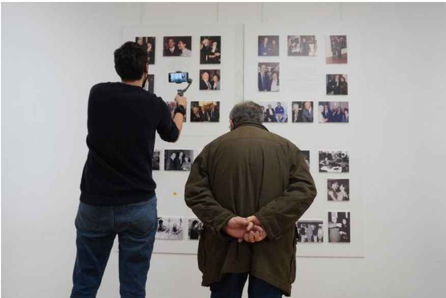
Izložba Eve Fischer privukla je nekoliko generacija posjetitelja

Riječ je o svjetski poznatoj slikarici rođenoj u Daruvaru čiji život i djelo većina Daruvarčana zapravo tek upoznaje. U svijetu slikarstva o njezinom radu, ali i cjelokupnom životu, govori se s velikim poštovanjem. Eva je umjetnički brend koja se na inicijativu zamjenice gradonačelnika Vande Cegledi i uz pomoć obitelji poznate slikarice, vratila u Daruvar početkom ove godine.